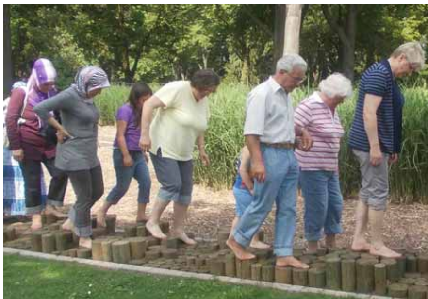
Interkulturelle Begegnung bei gemeinsamen Aktivitäten.

Eine türkische Mitarbeiterin unterstützt die interkulturelle Arbeit und Vernetzung mit türkischen Bürgerinnen und Bürgern, deren Anteil an der Gesamtbevölkerung