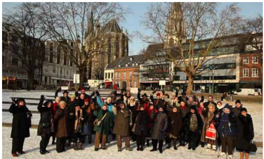
„Öcher Frönnde“ im Winter 2011

Das Projekt sollte auf verschiedene Probleme in unserer Gesellschaft