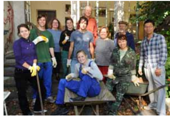
Freiwillige sorgen für Barrierefreiheit.

Die erste Starthilfe der Kommune hat die Gründung des Nachbarschaftsrings ermöglicht, danach mussten wir uns selbstständig machen und zogen ins leider nicht barrierefreie Welthaus Aachen um. Unsere Mitgliederzahl stieg stetig, trotzdem hatten wir wenig Geld. Wir wollten den Mitgliederbeitrag von einem Euro pro Monat nicht erhöhen, damit alle Interessenten sich die Mitgliedschaft leisten konnten. Freiwillig spendeten wohlhabendere Mitglieder zusätzlich, so dass wir gerade die Miete, die Telefonkosten,