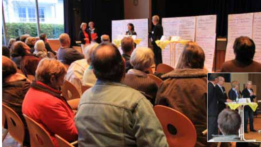
ZWAR-Netzwerkgründung in Halver, April 2012

In Nordrhein-Westfalen gibt es 150 ZWAR-Netzwerke mit 1.500 Interessens- und Projektgruppe in über 50 Kommunen (Stand 2012). Ein ZWAR-Netzwerk ist stadtteilorientiert und besteht aus der ZWAR-Basisgruppe und unterschiedlichen Interessens- und Projektgruppen. An der Basisgruppe nehmen alle ZWAR-Netzwerkteilnehmerinnen und -teilnehmer teil. Die Basisgruppe findet alle zwei Wochen statt und dient der Planung von Aktivitäten der unterschiedlichen Interessens- und Projektgruppen und dem Erfahrungsaustausch. Die Aktivitäten der Interessens- und Projektgruppen sind vielfältig und erstrecken sich