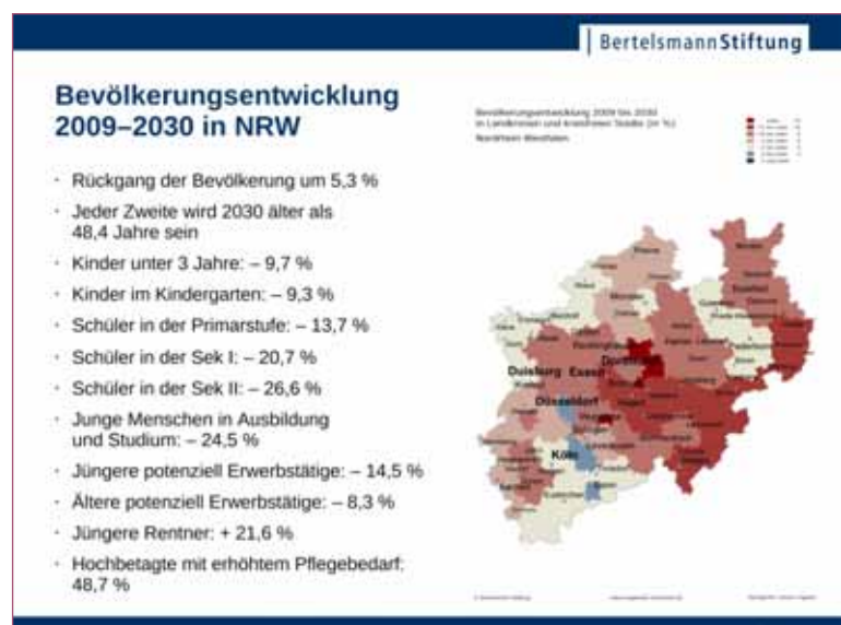
Abb. 1: Bevölkerungsentwicklung 2009 bis 2030 in NRW

Jede Kommune muss ihre eigenen Fragen vor dem Hintergrund der individuellen Herausforderungen entwickeln und nach Antworten suchen. Hierbei sind wichtige kommunale Akteure (z. B. aus Rat, Verwaltung, Wohlfahrtsverbänden, Seniorenorganisationen, Kirchen, Gesundheit oder Pflege) zu beteiligen.